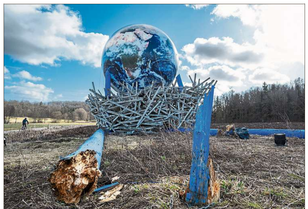
Das Gewinnerfoto: eine Kunstaktion im Vogelnest auf der »Sculptoura«.

Gesucht waren kreative Fotos, die spannende Perspektiven auf die Kunst im Landkreis werfen. Zudem sollte der Fotowettbewerb da-