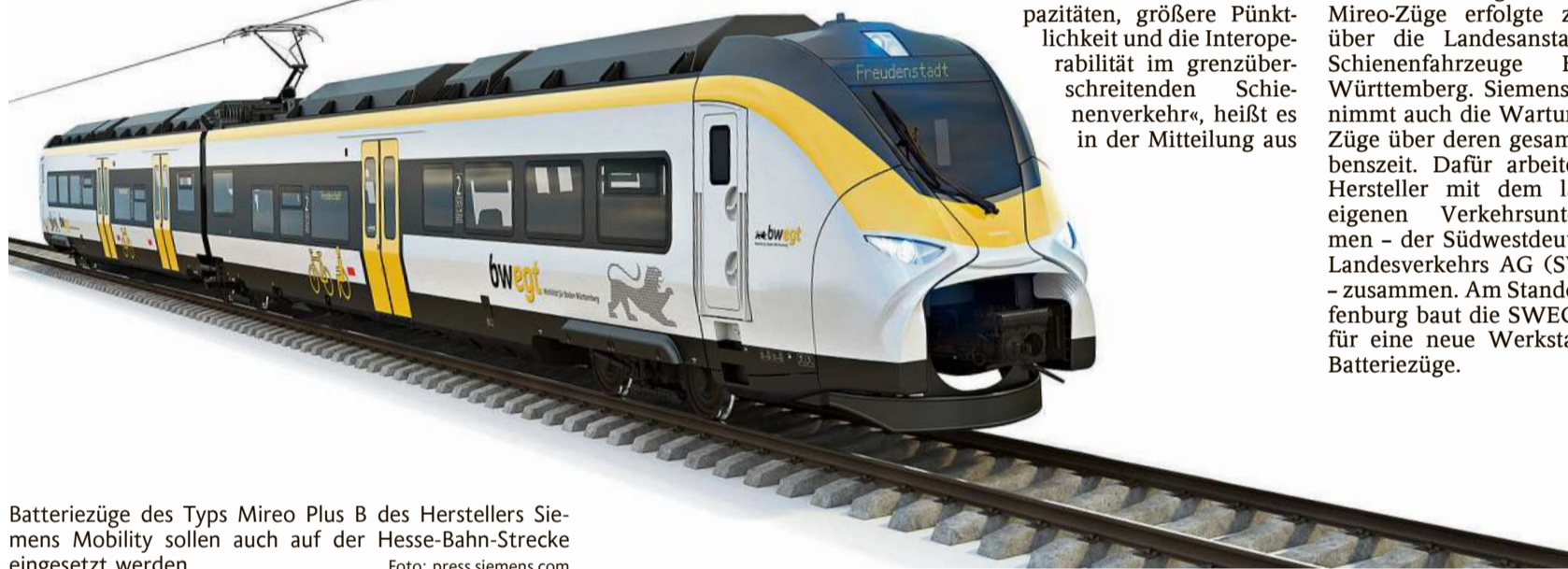
Batteriezüge des Typs Mireo Plus B des Herstellers Siemens Mobility sollen auch auf der Hesse-Bahn-Strecke eingesetzt werden.

Die Bestellung der neuen Mireo-Züge erfolgte zentral über die Landesanstalt für Schienenfahrzeuge Baden-Württemberg. Siemens übernimmt auch die Wartung der Züge über deren gesamte Lebenszeit. Dafür arbeitet der Hersteller mit dem landeseigenen Verkehrsunternehmen – der Südwestdeutschen Landesverkehrs AG (SWEG) – zusammen. Am Standort Offenburg baut die SWEG hierfür eine neue Werkstatt für Batteriezüge.