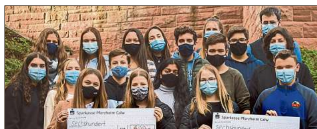
Die Schüler mit den Spendenschecks

Die Arbeit der Kinderkreishilfe in Tübingen wurde es, nicht zuletzt deshalb, weil sich die Schüler dem Schicksal junger Krebspatienten nahe fühlen. So wurde die Klassenkasse geplündert und jeweils 300 Euro zur Verfügung gestellt. Als ein Vater der Schüler im Lions Club Hirsau darüber sprach, beschloss der Club spontan, den Betrag zu verdoppeln um so das Engagement der Schüler zu würdigen.